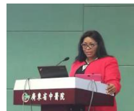
参加广东省医疗安全协会与广东省中医院的 医院管理提升培训讲座

科为一体的美国西南医学中心大型教学医院并培养了无数医学顶尖人才，然而五年前的设施与管理漏洞，以及出现的一系列致命缺陷与患者安全事件，几乎导致医院关闭的境地……5 年来，在地方政府、大学、市民的积极支持与帮助下，帕克蓝医院励精图治，卧薪尝胆，经过巨大努力，起死回生，伴随着 2015 年最新医院的诞生，使其重新回到了美国一流医院的行列，凤凰涅槃，重现辉煌。这样的经历，难道不是值得我们深度思考与借鉴的吗？马吉丽女士的“护理驱动变革，改