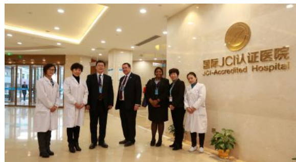
访问江西省第一家JCI认证医院— 江西嘉佑集团仁爱妇产医院

此次国际化系列高峰论坛，是在《医疗质量管理办法》刚刚推行后由美国大型医疗集团与国内医疗机构联合安排进行的一次内容极其丰富，以鲜活生动的实际案例进行的深入讨论，意义重大，影响广泛。在南国之都、在革命圣地、在西子湖畔，跨越大半个中国，系列论坛受到热情欢迎，反响热烈，