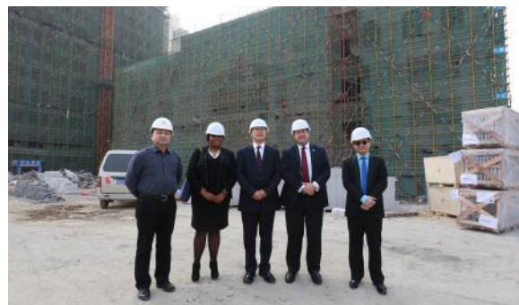
访问江西最大民营医疗集团在建中的健康城