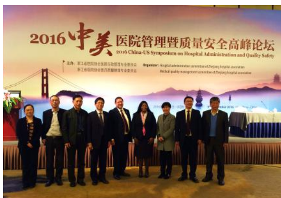
参加浙江省医院协会的医院管理暨质量安全高峰论坛